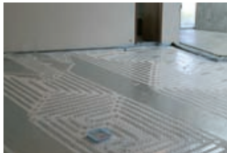
Trockenbausystem (Renovierung Kirche Mater Dolorosa, Langenau, CTX 14 x 2)