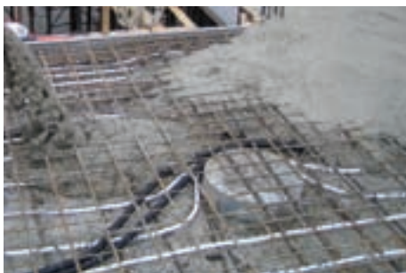
Betonkernaktivierung (Sparkassen-Versicherung, Ulm, CTX 16 x 2)