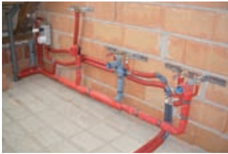
Sanitärinstallation (CTX 16 x 2 und 20 x 2)