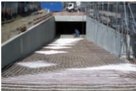
Freiflächenheizung Schneefreihaltung (Astra Unterföhring, CTX 20 x 2 mit CTX-Schiebehülse)