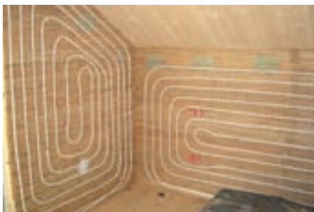
Wandheizung auf Schilfmatte mit Lehmputz (CTX 14 x 2)