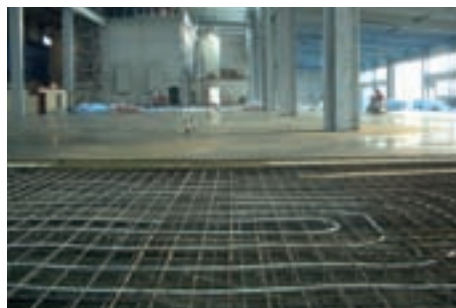
Industrieflächenheizung (erhöhte Verkehrslast, Karger GmbH Mertingen, CTX 16 x 2)