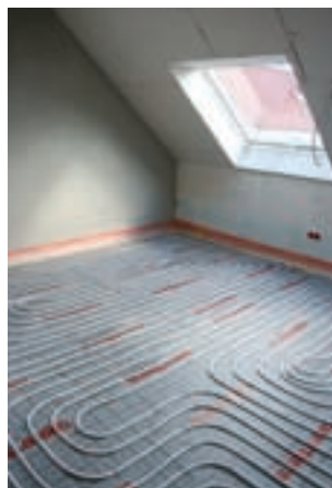
Fußbodenheizung/-kühlung mit Nassestrich (Wohnbereich, CTX 14 x 2)