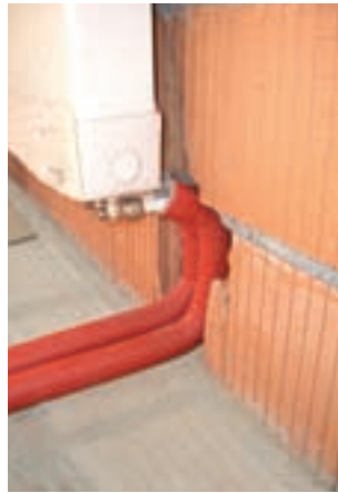
Heizkörperanbindung (z. B. CTX 14 x 2)